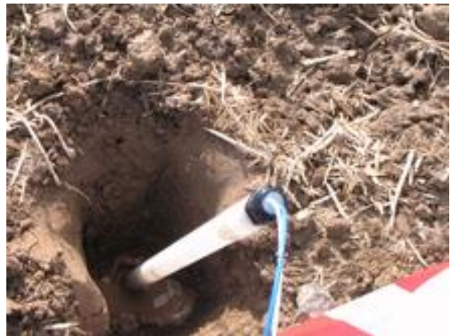
Aufbau der Saugkerzenanlage zur Beprobung des Sickerwassers (links) und Einschlämmen einer Saugkerze (rechts)